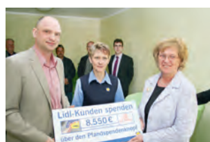
Der Lebensmitteldiscounter LIDL ist einer unserer vielen langjährigen, treuen Kooperationspartner.