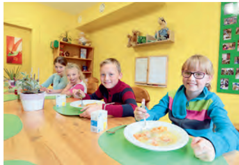
Glückliche Kinderaugen: Das Essen schmeckt den kleinen Gästen im frisch renovierten und neu gestalteten Speiseraum des KinderTisches sehr gut.

sodass wir uns natürlich über neue Paten bzw. die Verlängerung von bereits bestehenden Patenschaften freuen würden. (180,00 Euro im Jahr)