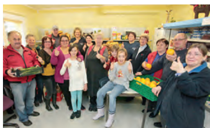
Daumen hoch für die vielen Spender: Das Helfer-Team der Stralsunder Tafel dankt allen Unterstützern für ihr finanzielles Engagement.

aktion „Helfen bringt Freude!“ Ende des Jahres 2014 konnte ein neuer Mercedes-Transporter für die Stralsunder Tafel gekauft werden. Im Frühjahr 2015 wurde das fabrikneue Fahrzeug über das Autohaus „Boris Becker“ ausgeliefert, und seitdem ist der Transporter im Dauereinsatz. Das Fahrzeug verfügt über die vom