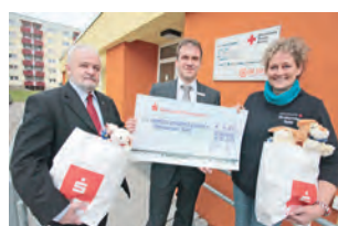
Die Sparkasse Vorpommern zählt zu den großzügigsten Tafel-Spendern aus der gesamten Region.