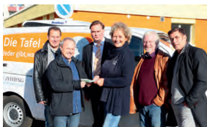
Treue Spender: Mit 1000 Euro unterstützen die Mitglieder des Vereins „Stralsunder Musikernacht“ auch in diesem Jahr die Stralsunder Tafel.

Nette Mädchen und Jungen mit Zipfelmütze sind mittlerweile vor dem Eingang des Citti-Marktes im Strelapark schon zu einem gewohnten Bild geworden. Jedes Jahr in der Vorweihnachtszeit sammeln Mitglieder des LEO-Clubs unter dem Motto „Kauf ein Teil mehr“ mit großem Engagement Lebensmittel für Bedürftige der Stadt und helfen so, den Tisch so mancher Familie mit abwechslungsreicher Kost oder den bunten Teller der Kinder mit Leckereien zu füllen. Auch Leergut kann hier gespendet werden, dessen Erlös die fleißigen Helferinnen und Helfer nutzen, um dringend benötigte Waren für die Lebensmittelausgabe in der Parkstraße 9 einzukaufen. Zwischen 15 und 20 Kisten voll mit Obst, Konserven, Brot und anderen Waren sind in jedem Jahr gespendet worden.