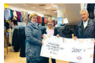
Die Bekleidungskette C&A unterstützte die Stralsunder Tafel in den vergangenen 20 Jahren regelmäßig.