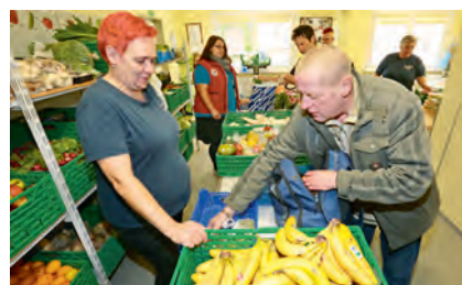
Die Zahl der bedürftigen Menschen, die auf die Hilfe der Stralsunder Tafel angewiesen sind, steigt von Jahr zu Jahr.